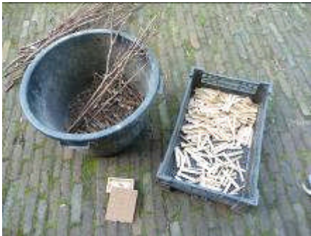
Aanmaakhoutjes (met hamer en mes splijten van dun plankje) Aanmaakblokjes Lucifers