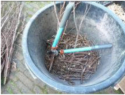
Brandhout Op maat breken en knippen