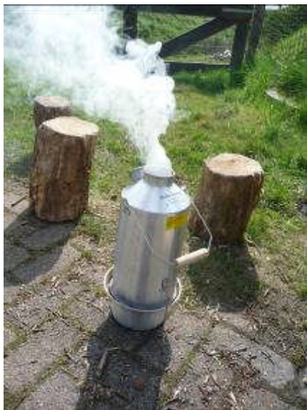
Vul het stookbakje Onderop 5 vuren houtjes Daarop aanmaakblokjes Daarop kleine piramide van wilgentakjes Passend binnen de rand van het bakje

Steek met lucifer het aanmaakblokjes aan